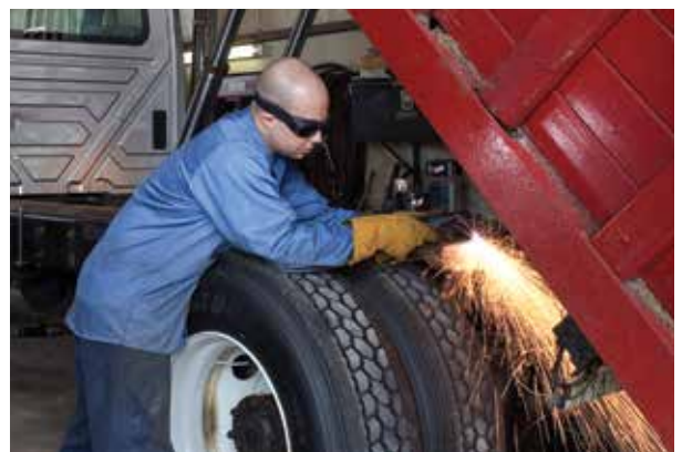
Fahrzeugreparatur und -umbau